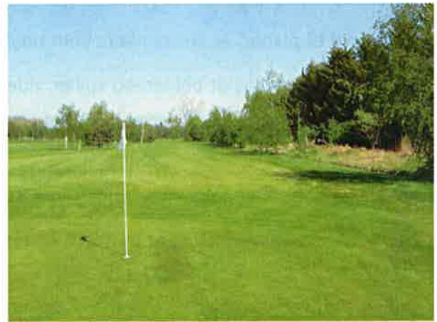
8. hul set fra bag greenen