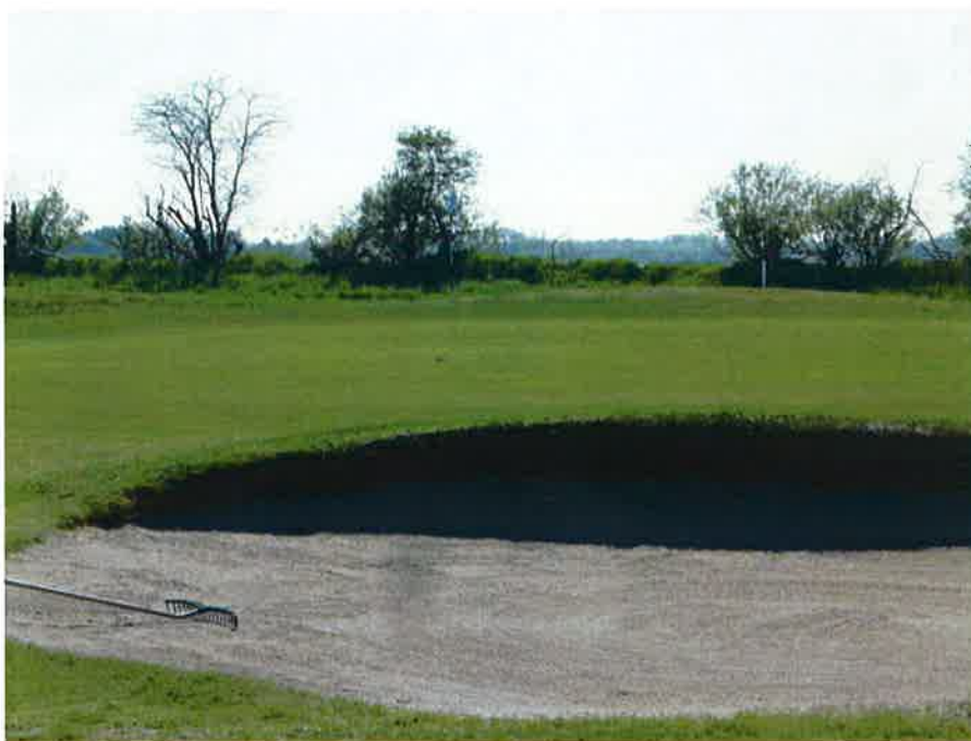
Greenbunkeres har den tilstræbte links-karakter med lidt sandface mod spilleren.