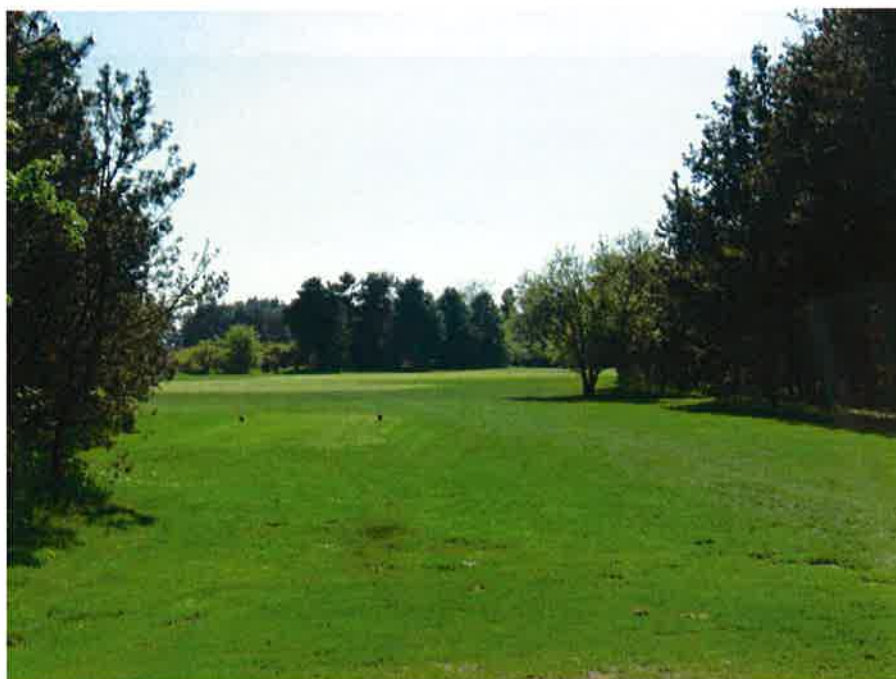
På 9. hul bør den "blinde" fairwaybunker i venstre side af fairwayen erstattes med en MH . Træerne i højre side bør tyndes og opstammes så man fra teestedet "kan se ind under de tilbageværende træer. Mod 8. hul bør der (af hensyn til træernes liv) tyndes kraftigt ud.