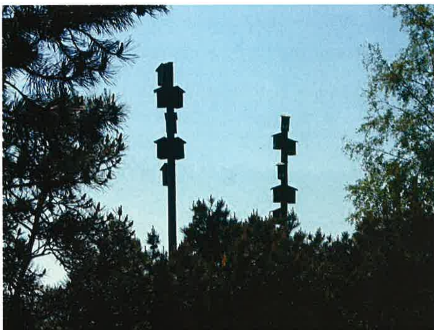
Stærekasser ved 14. tee.