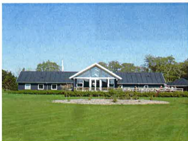
Bed foran klubhuset bør "bearbejdes"

Ikke noget med at iscenesætte et parklignende landskab.