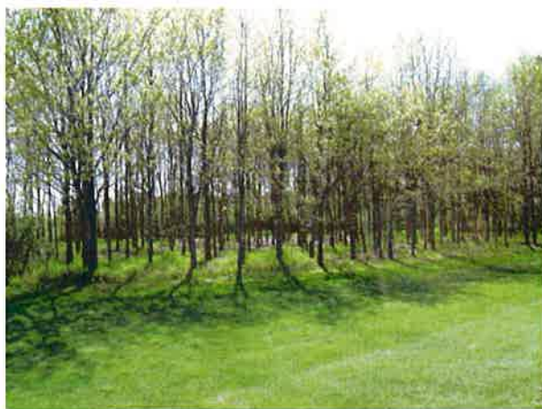
Egebanken ved 10. hul

Med hensyn til de gamle træer på "de nye huller" er der på 1. og 7. hul og endvidere 10. 14. og 17. hul tale om en vis udtynding og opstamning.