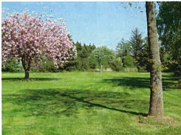
6. hul på Par-3 banen