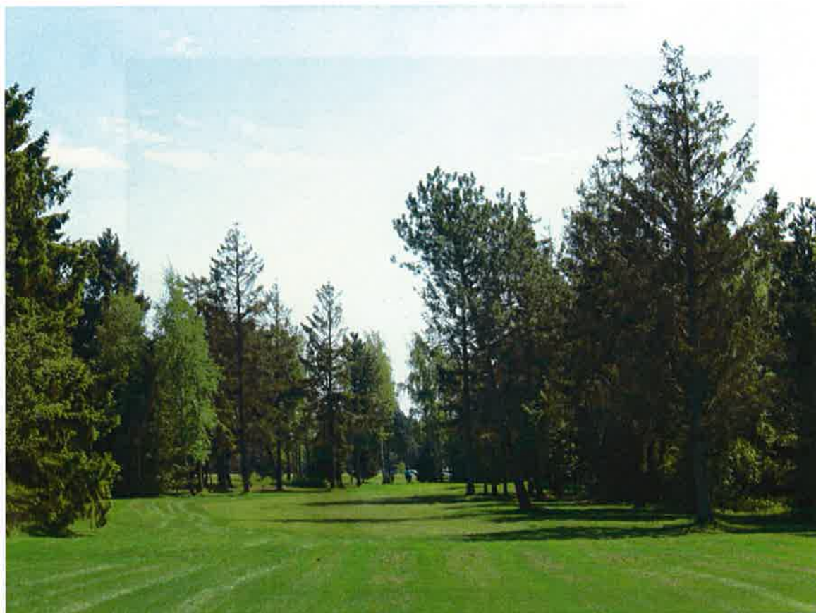
9. hul på Par-3 banen

Som tidligere nævnt, er det vigtigt at man løbende udviser og fjerner træet, også på PAR-3 banen. Dette bør gøres af to grunde.