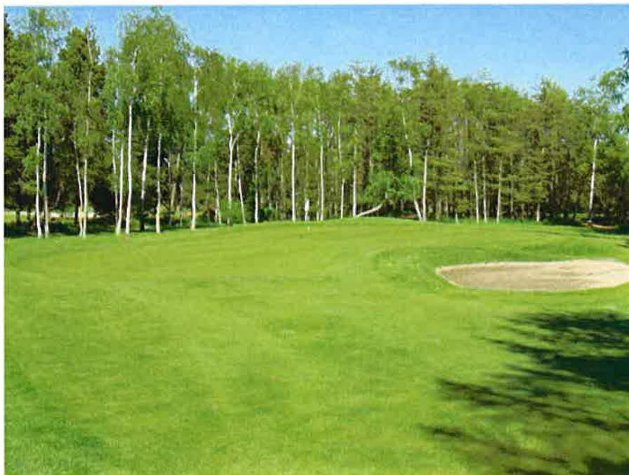
8. green igen. En flot green. Godt søen blev fjernet.