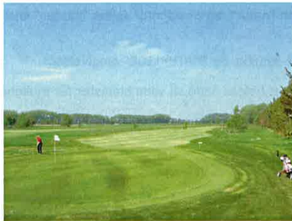
5. green set fra bag greenen