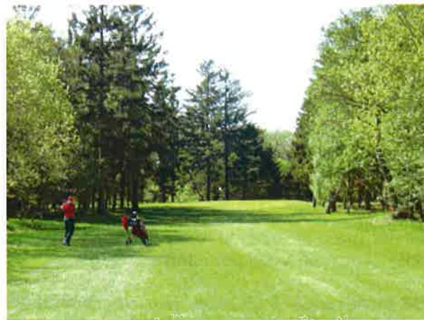
10. green, hvor der skal tyndes ud i begge sider

Endelig foreslås det i Masterplanen at flytte (så mange som det nu er muligt) af de eksisterende egetræer som står i " egebanken " til venstre i doglegget på 10. hul og genplante dem i de viste 3 nye områder .