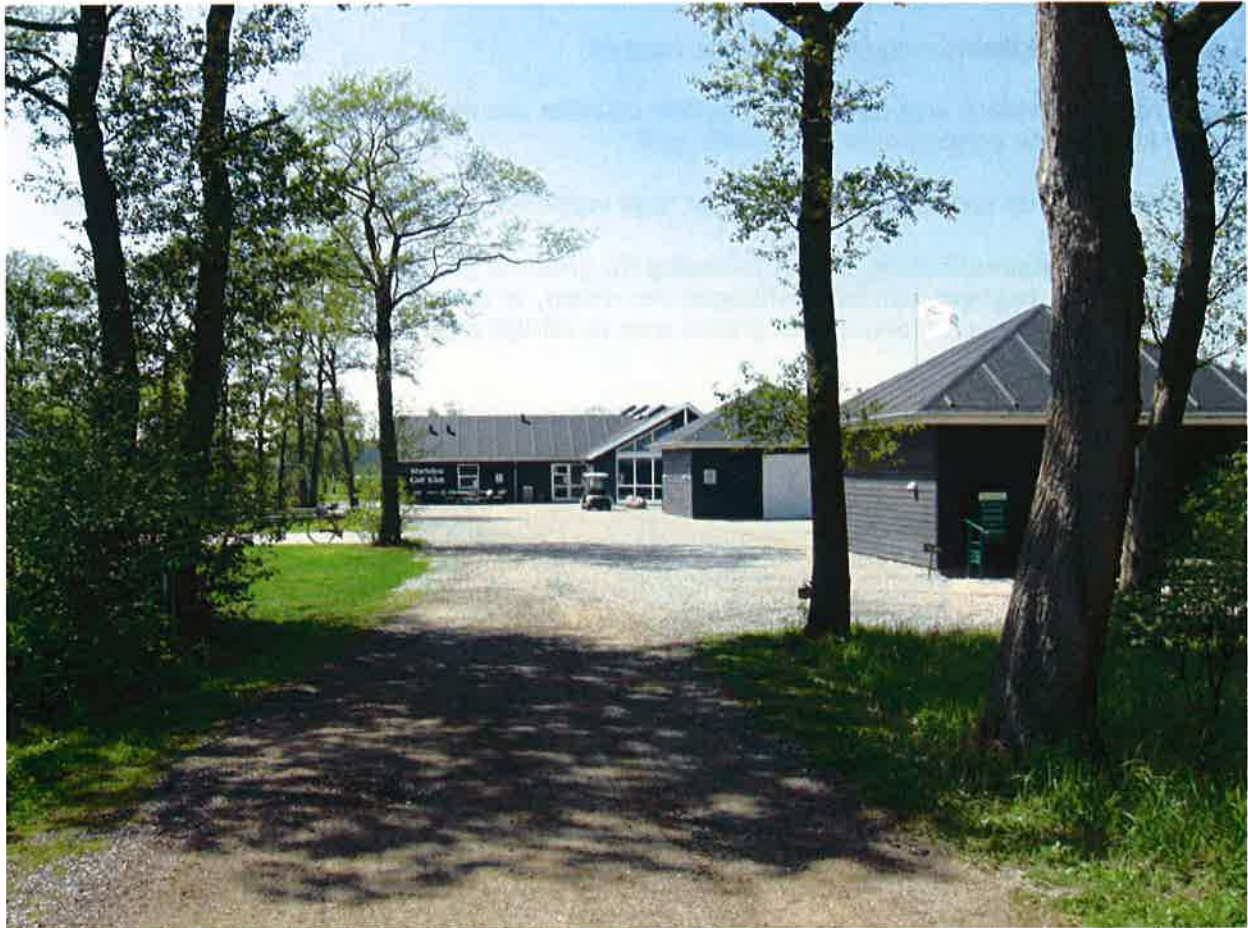
Indgangsparti til klubhus