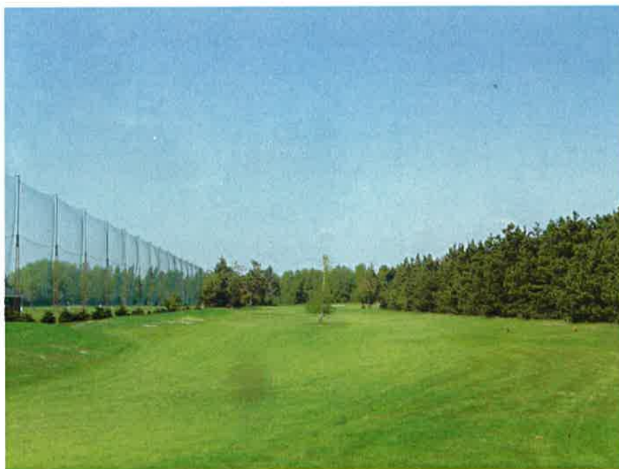
1. hul – der skal tyndes ud i højre side. Er grenen til venstre 220 meter fremme gået ud?