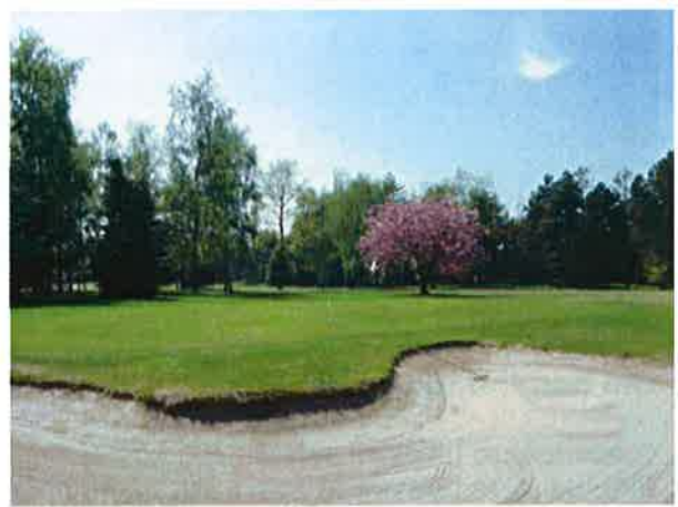
6. Hul set fra bag greenen