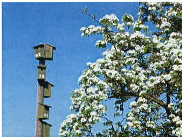
Stærekasser mellem 15. og 17. green

Hvordan er græskvaliteten , er den forskellig fra green til green, er det svært at komme rundt på banen p.g.f. fugtige områder , mangler der dræn , er der greens som har et dårligt vækstlag som bør udskiftes, er der greens som er dårligt drænet m.m.