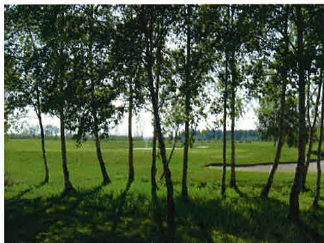
Birkelunden bag 18. green, en smuk detalje.