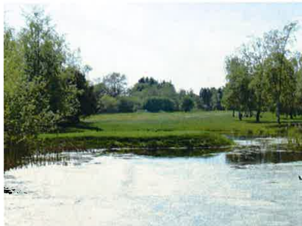
6. hul, er der lidt heroisk design her?

Slog man et skævt slag blev men oftest straffet.